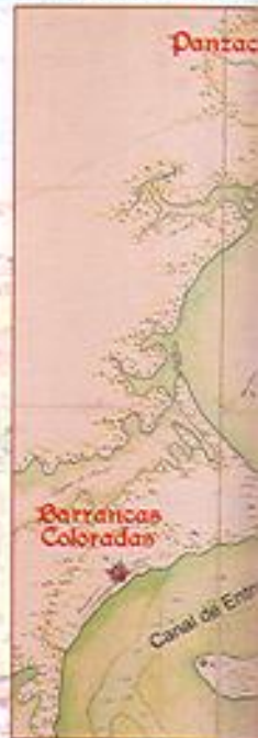
Bahía de Panzacote, Instituto de M...

En aquel mismo año de 1775 España envió una expedición contra Argel; convertida en la base desde la cual los piratas acosaban el tráfico marítimo en la costa sur de España. El desembarco de las tropas al mando del general O'Reilly terminó siendo un auténtico fracaso, lo que obligó