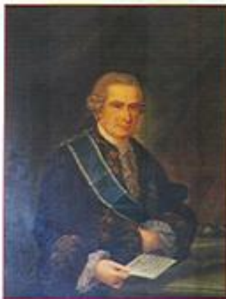
José de Gálvez

Bernardo de Gálvez nació en Macharaviaya, Málaga, el 23 de julio del año 1746. El primer dato cierto que se conoce de su trayectoria es que en 1762, con 16 años, se alistó voluntario en el regimiento francés Royal Cantabrie , que había llegado a España para luchar junto al ejército español contra Portugal.