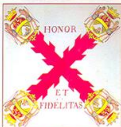
Ministerio de Cultura. Archivo General de Indias. MP. Bandera

a la retirada de las fuerzas españolas. En los combates que se desarrollaron en las playas de Argel Gálvez resultó gravemente herido el día 8 de julio por bala de fusil en la pierna izquierda.