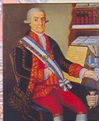
Matías de Gálvez.

Los triunfos que acabamos de recordar fueron casi simultáneos con los que obtuvo su padre don Matías de Gálvez, que venció a los ingleses que habían invadido las costas de Honduras y Nicaragua, recuperando el fuerte de San Fernando de Omoa y la isla de Roatán. En recompensa fue ascendido a teniente general y poco después nombrado Virrey de Nueva España. Su mandato fue muy breve, pero se caracterizó por el impulso que prestó a las obras públicas y a la Cultura, y llegó a ser muy querido por los mexicanos. Falleció en 1784.