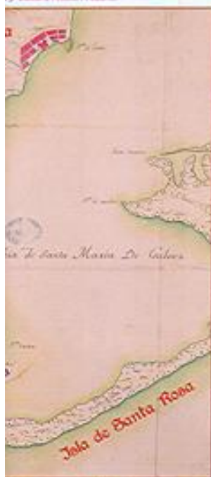
Mapa de la cultura militar, Madrid

Al estallar en 1779 la guerra de Francia y España contra la Gran Bretaña, Bernardo de Gálvez, con apenas setecientos hombres, inició en septiembre las hostilidades contra los ingleses, y pese a la inferioridad de sus efectivos conquistó Manchak, Baton Rouge y Natchez, lo que supuso arrojar a los británicos del Misisipí. Estos brillantes triunfos le valieron el ascenso a mariscal de campo, cuando acababa de cumplir 33 años.