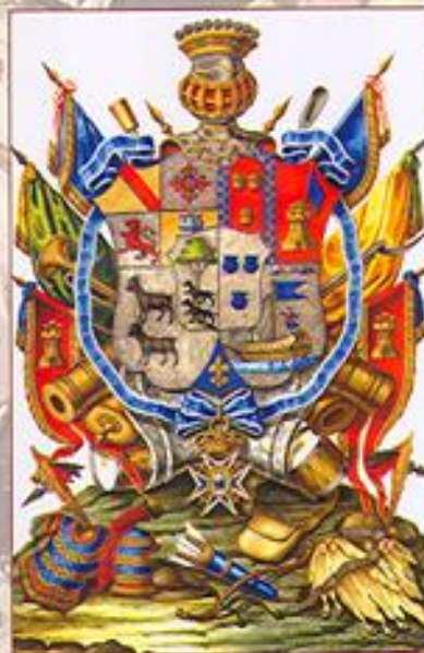
Blasón de Bernardo de Gálvez.

Por su bondad, por su llaneza y su simpatía, el pueblo mexicano llegó a venerar al Virrey. Pero la enfermedad intestinal que había contraído en Nueva Orleans se fue agravando, hasta que 30 de noviembre de 1786 falleció en Tacubaya, entonces un pequeño pueblo cercano a México. Los restos de Bernardo de Gálvez descansan en la iglesia del Colegio Apostólico de San Fernando, frente a su padre.