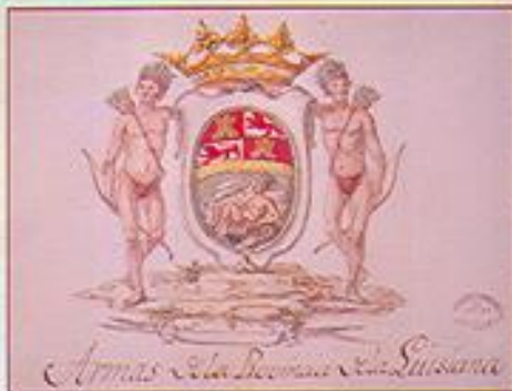
Ministerio de Cultura. Archivo General de Indias. MP. Escudo-129

Superando nuevos obstáculos, Gálvez partió de Cuba al mando de una nueva expedición, que desembarcó el 9 de marzo de 1781 en la isla de Santa Rosa, que cerraba el canal de entrada a la bahía de Panzacola, defendido por el fuerte británico de Barrancas Coloradas, artillado con 5 piezas de 32 libras y 6 de 8 libras.