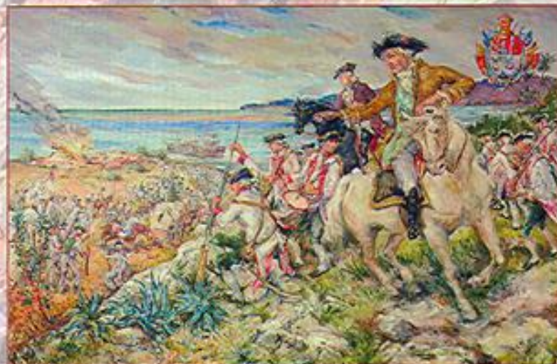
Bernardo de Gálvez en Panzacola. Obra de Rodrigo Yrion